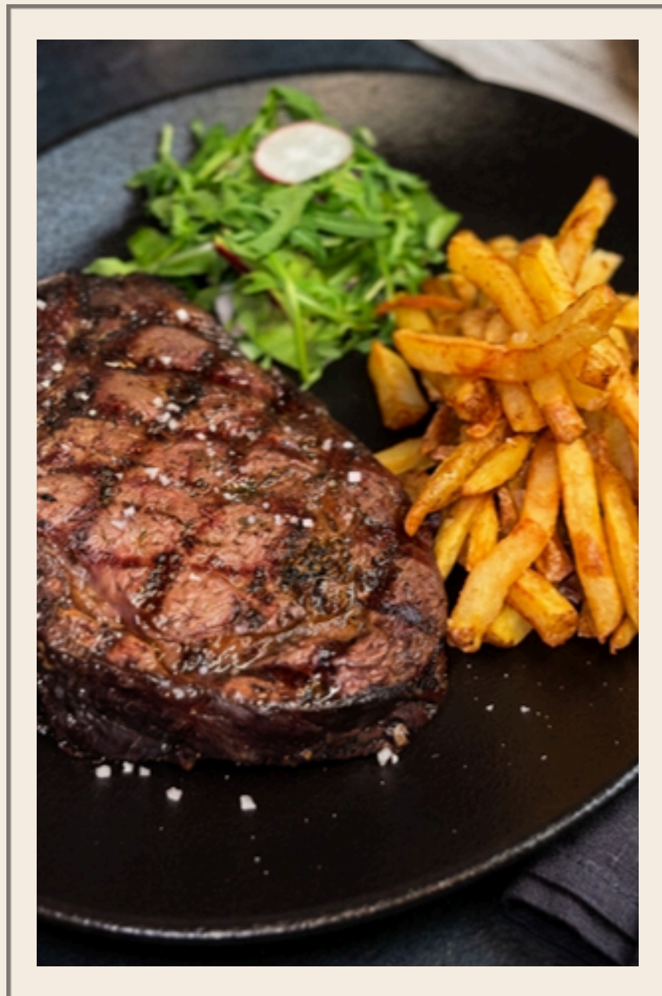
CÔTE / ENTRECÔTE