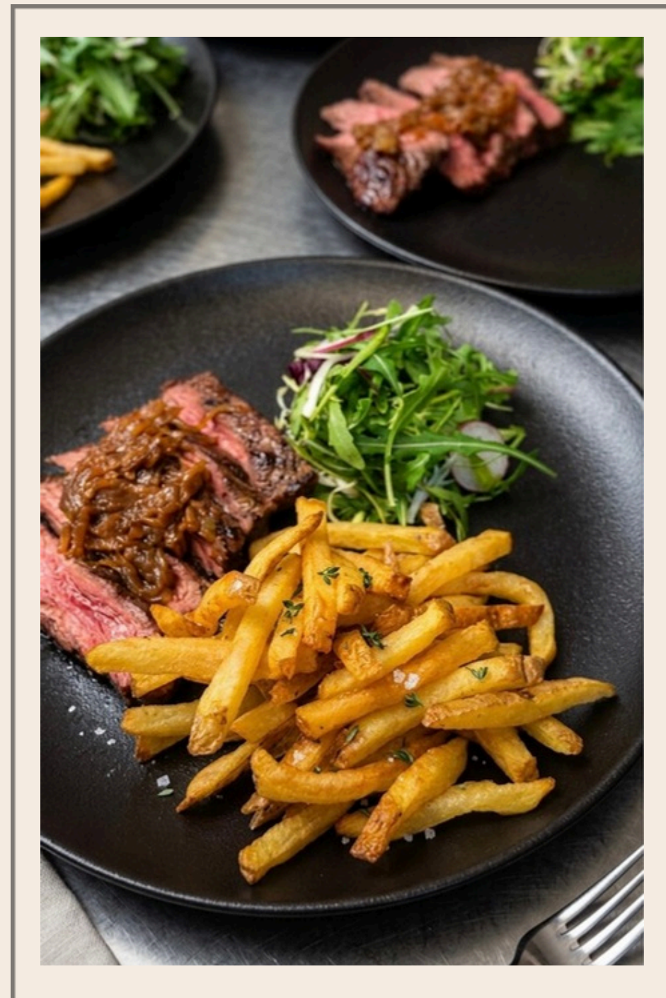
BAVETTE FAÇON ARGENTINE