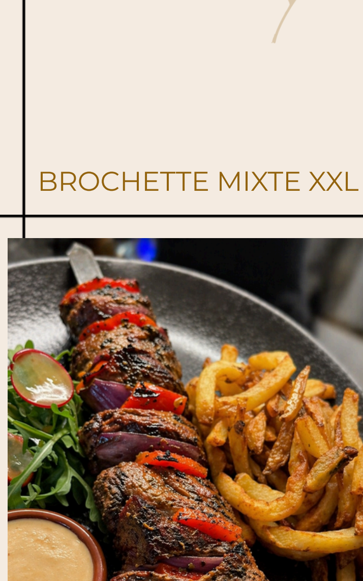
BROCHETTE MIXTE XXL